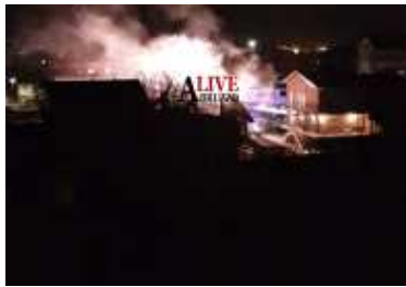
A fuoco un'abitazione, paura per una famiglia che riesce a mettersi in salvo: ingenti i danni (video)