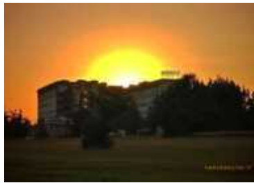
Medicina covid ospedale Avezzano: solo 7 infermieri e pochi oss, è allarme personale