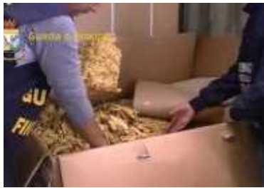
Contrabbando di tabacco, operazione GdF: 7 avvisi di garanzia e sequestro da oltre 1200 chili