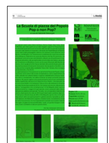
Superficie 77 %

ARTICOLO NON CEDIBILE AD ALTRI AD USO ESCLUSIVO DEL CLIENTE CHE LO RICEVE - 3423