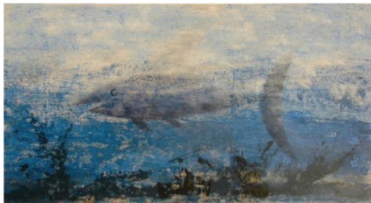
Pino Pascali, Pesce , 1964