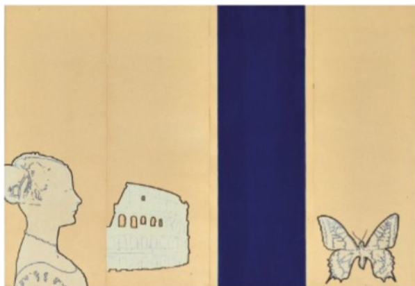
Renato Mambor, Campionatura , 1966

Presidente Fondazione Terzo Pilastro – Internazionale